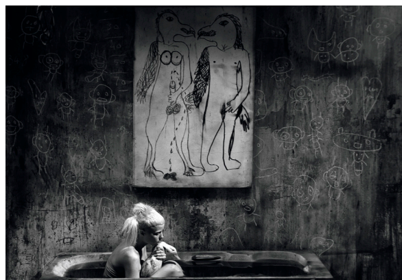
Bath Scene, 2012

‘Die Antwoord and Roger Ballen are family, Mr Ballen is our Number 1, our favourite artist alive on this planet, our master, and our friend.’