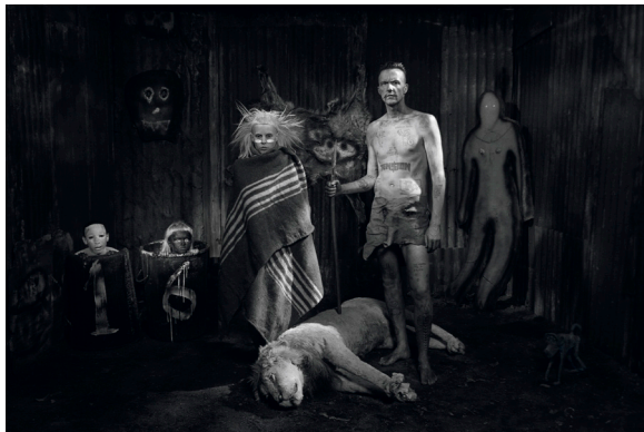
Shack Scene, 2012 © Roger Ballen