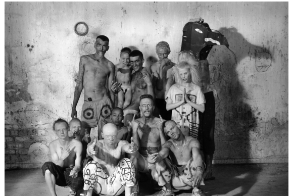
Cast of Freaky, 2012